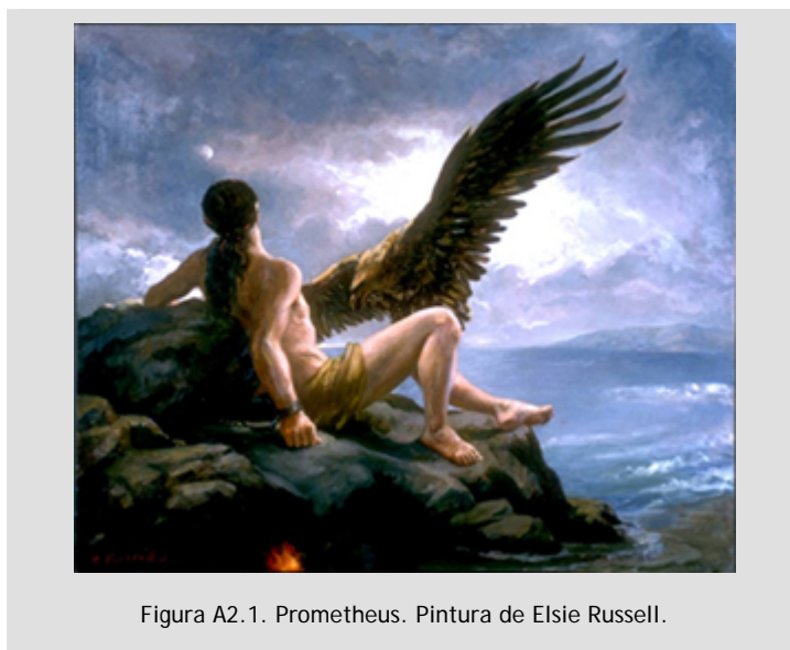
Figura A2.1. Prometheus. Pintura de Elsie Russell.

Por sua vez, o mito das Cinco Idades, para Souza Brandão, é introduzido como forma de explicar a “a degradação da humanidade”. (30) Entretanto, este mito (figura A2.1) não revela “...apenas a decadência do homem, mercê do ‘crime’ de Prometeu e do envio de Pandora, mas, acima de tudo, a necessidade do trabalho e o dever de ser justo”. (31) (gm)